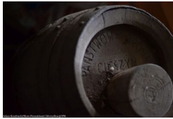
Pamiętki przeszłości w dawnej gospodzie