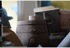
Pamiętki przeszłości w dawnej gospodzie