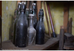
Pamiętki przeszłości w dawnej gospodzie