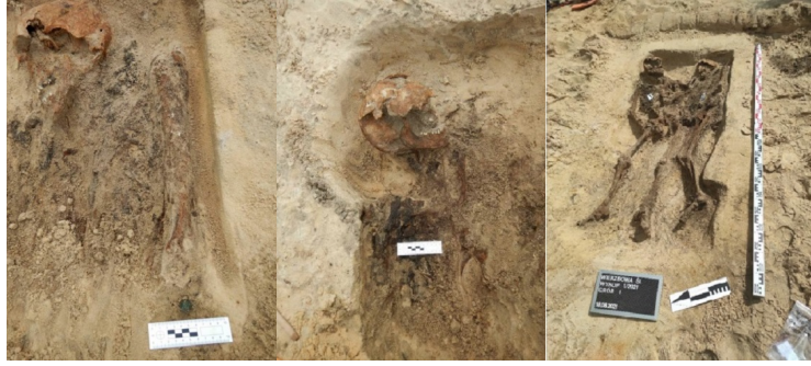
Biuro Poszukiwań i Identyfikacji