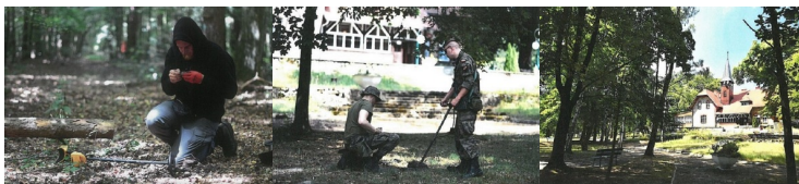
Biuro Poszukiwań i Identyfikacji IPN