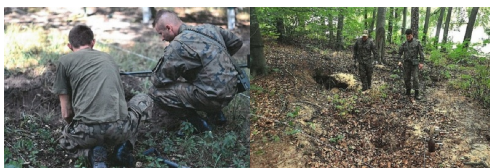
Biuro Poszukiwań i Identyfikacji IPN