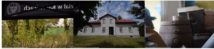
Budynek dawnej gospody "Na Pikietach"