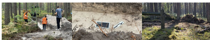
Prace poszukiwawcze w Palmirach