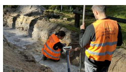
Prace poszukiwawcze w Palmirach