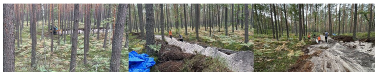
Prace poszukiwawcze w Palmirach