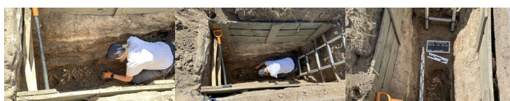
Łódź: Odnaleziono szczątki nastolatka