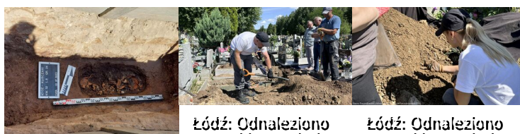
Łódź: Odnaleziono szczątki nastolatka

https://ipn.gov.pl/pl/publikacje/ksiazki/173922,Dzieci-z-zielo-nego-autobusu-Z-zeznan-o-niemieckim-obozie-dla-polskich-dzieci-prz.html