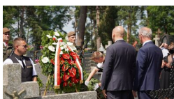
IPN Oddział Lublin