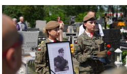
IPN Oddział Lublin