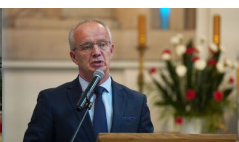
IPN Oddział Lublin