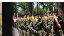
IPN Oddział Lublin