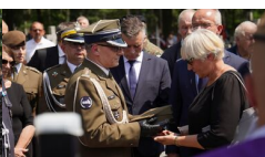
IPN Oddział Lublin