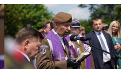
IPN Oddział Lublin