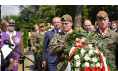
IPN Oddział Lublin

Kalendarium Prac Rok 2003 Rok 2006 Rok 2007 Rok 2008 Rok 2009 Rok 2011 Rok 2012