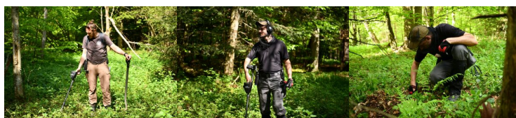
Muczne: Poszukiwania szczątków ofiar zbrodni OUN/UPA (II etap)