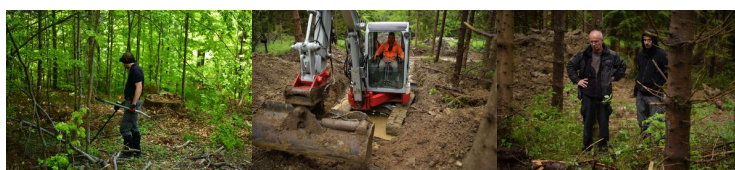
Muczne: Poszukiwania szczątków ofiar zbrodni OUN/UPA (II etap)