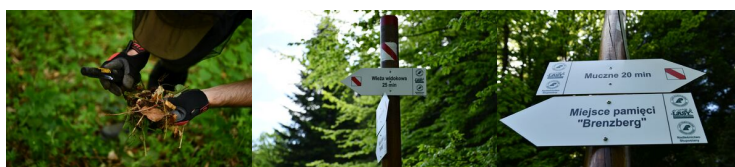
Muczne: Poszukiwania szczątków ofiar zbrodni OUN/UPA (II etap)