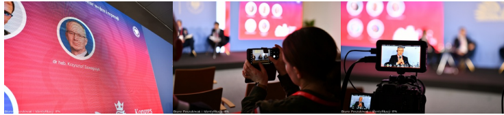
Kongres Pamięci Narodowej - Panel o poszukiwaniach