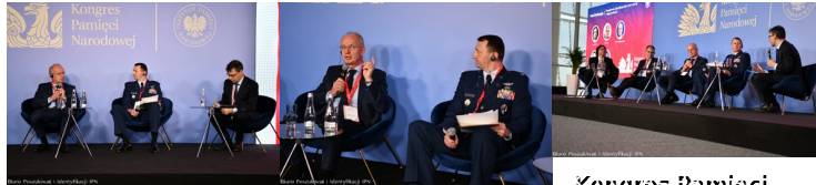
Kongres Pamięci Narodowej - Panel o poszukiwaniach