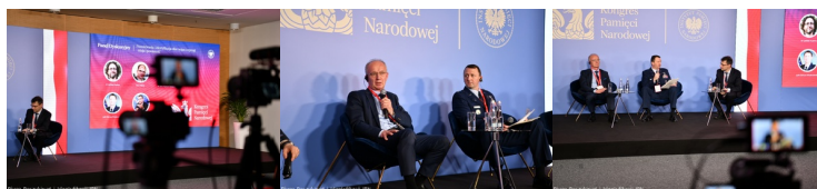
Kongres Pamięci Narodowej - Panel o poszukiwaniach