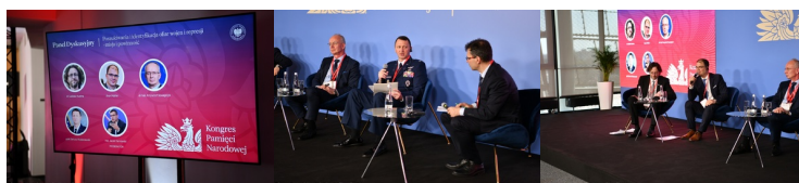
Kongres Pamięci Narodowej - Panel o poszukiwaniach