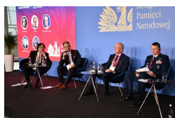
Kongres Pamięci Narodowej - Panel o poszukiwaniach