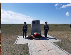
Polskie upamiętnienie. Memoriał w Spassku - 31.05.2022 r.