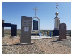
Żezkazgan, symboliczne upamiętnienie ofiar Gulagu i powstania w Kengirze, 26.05.2022 r.