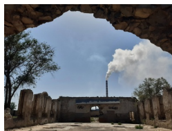
Ruiny stołówki w kengirskim łagrze, 26.05.2022 r.