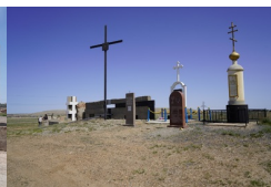
Żezkazgan, symboliczne upamiętnienie ofiar Gulagu i powstania w Kengirze, 26.05.2022 r.