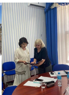
Muzeum Archeologiczno-Historyczne w Żezkazganie, 27.05.2022 r.