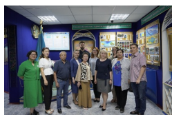
Muzeum Archeologiczno-Historyczne w Żezkazganie, 27.05.2022 r.