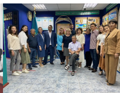
Muzeum Archeologiczno-Historyczne w Żezkazganie, 27.05.2022 r.