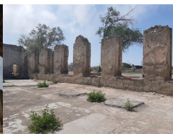
Ruiny stołówki w kengirskim łagrze, 26.05.2022 r.