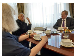
Karaganda, konferencja naukowa na Karagandyjskim Uniwersytecie im. A.E. Bukietova