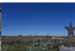
Karaganda, cmentarz przy kopalni Kostienki, 30.05.2022 r.