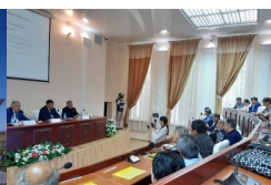
Karaganda, konferencja naukowa na Karagandyjskim Uniwersytecie im. A.E. Bukietova, 30.05.2022 r.