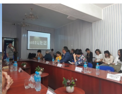
Muzeum Archeologiczno-Historyczne w Żezkazganie, forum historyczne, 27.05.2022 r.