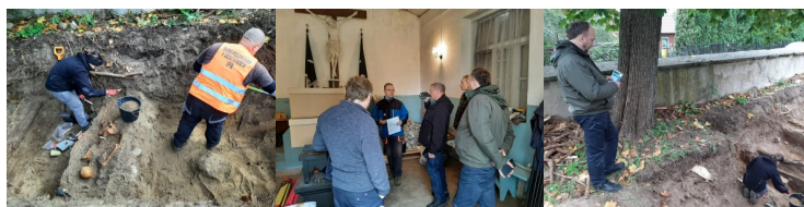
Suwałki. Prace na terenie cmentarza ewangelickiego