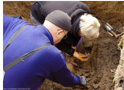
Poszukiwania Kazimierza Człowiekowskiego