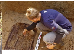
Poszukiwania Kazimierza Człowiekowskiego