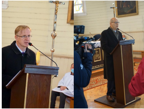
Uroczystości pogrzebowe ppor. Apoloniusza Duszkiewicza ps. Polza