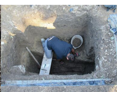
IPN Kraków. Poszukiwania