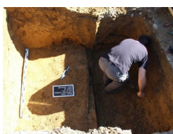
IPN Kraków. Poszukiwania