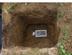
IPN Kraków. Poszukiwania