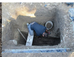
IPN Kraków. Poszukiwania