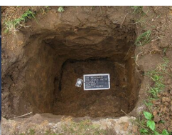
IPN Kraków. Poszukiwania