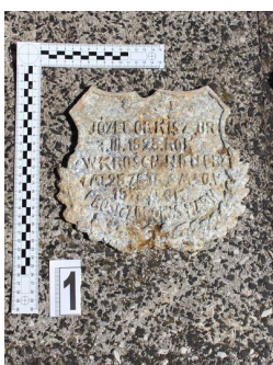
IPN Kraków. Poszukiwania