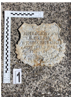
IPN Kraków. Poszukiwania