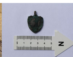
IPN Kraków. Poszukiwania