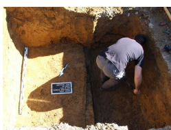
IPN Kraków. Poszukiwania