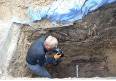
Lubartów: poszukiwania na cmentarzu