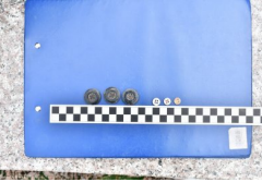
Lubartów: poszukiwania na cmentarzu