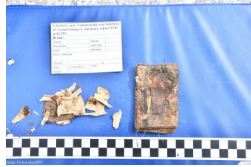
Lubartów: poszukiwania na cmentarzu