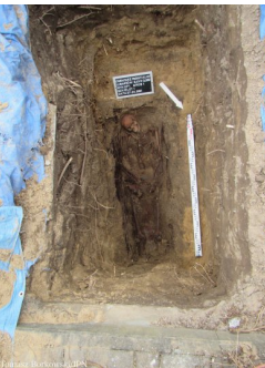
Lubartów: poszukiwania na cmentarzu