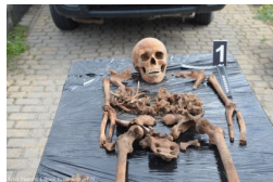
Lubartów: poszukiwania na cmentarzu