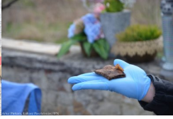
Lubartów: poszukiwania na cmentarzu