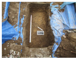
Lubartów: poszukiwania na cmentarzu