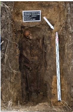
Lubartów: poszukiwania na cmentarzu