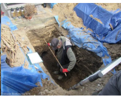
Lubartów: poszukiwania na cmentarzu