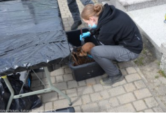
Lubartów: poszukiwania na cmentarzu