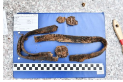
Lubartów: poszukiwania na cmentarzu