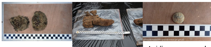
Lublin - cm. przy ul.