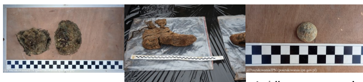
Lublin - cm. przy ul.