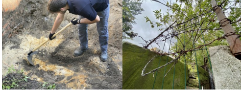
Warszawa: Poszukiwania w "Toledo"