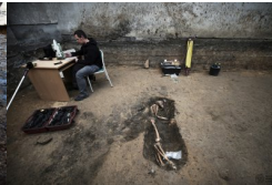
Album BPil IPN #4