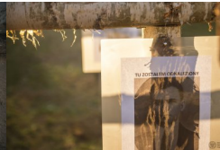
Album BPil IPN #5