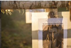
Album BPil IPN #5