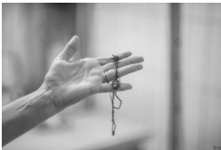
Album BPil IPN #1