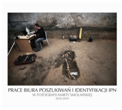
PRACE BIURA POSZUKIWAN I IDENTYFIKACJI IPN W FOTOGRAFII MAŁEY SMOLEŃSKIEJ 2015-2018