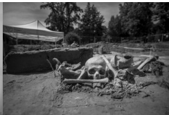
Album BPil IPN #2