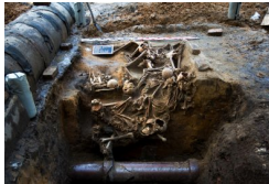
Album BPil IPN #3