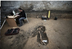
Album BPil IPN #4