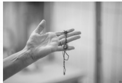
Album BPil IPN #1