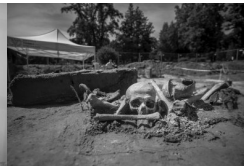
Album BPil IPN #2