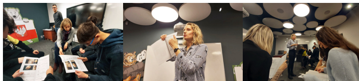
III Łączka_PH_Wars zawa #1