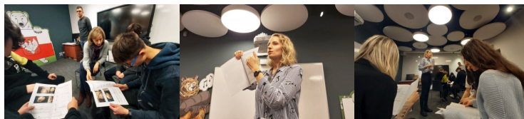
III Łączka_PH_Wars zawa #1