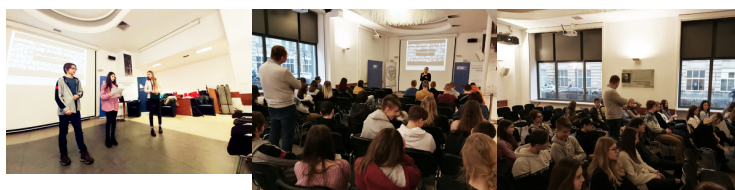
III Łączka_PH_Wars zawa #7