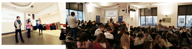
III Łączka_PH_Wars zawa #7