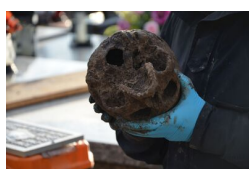
Tomaszów Lubelski _10_2019 #23